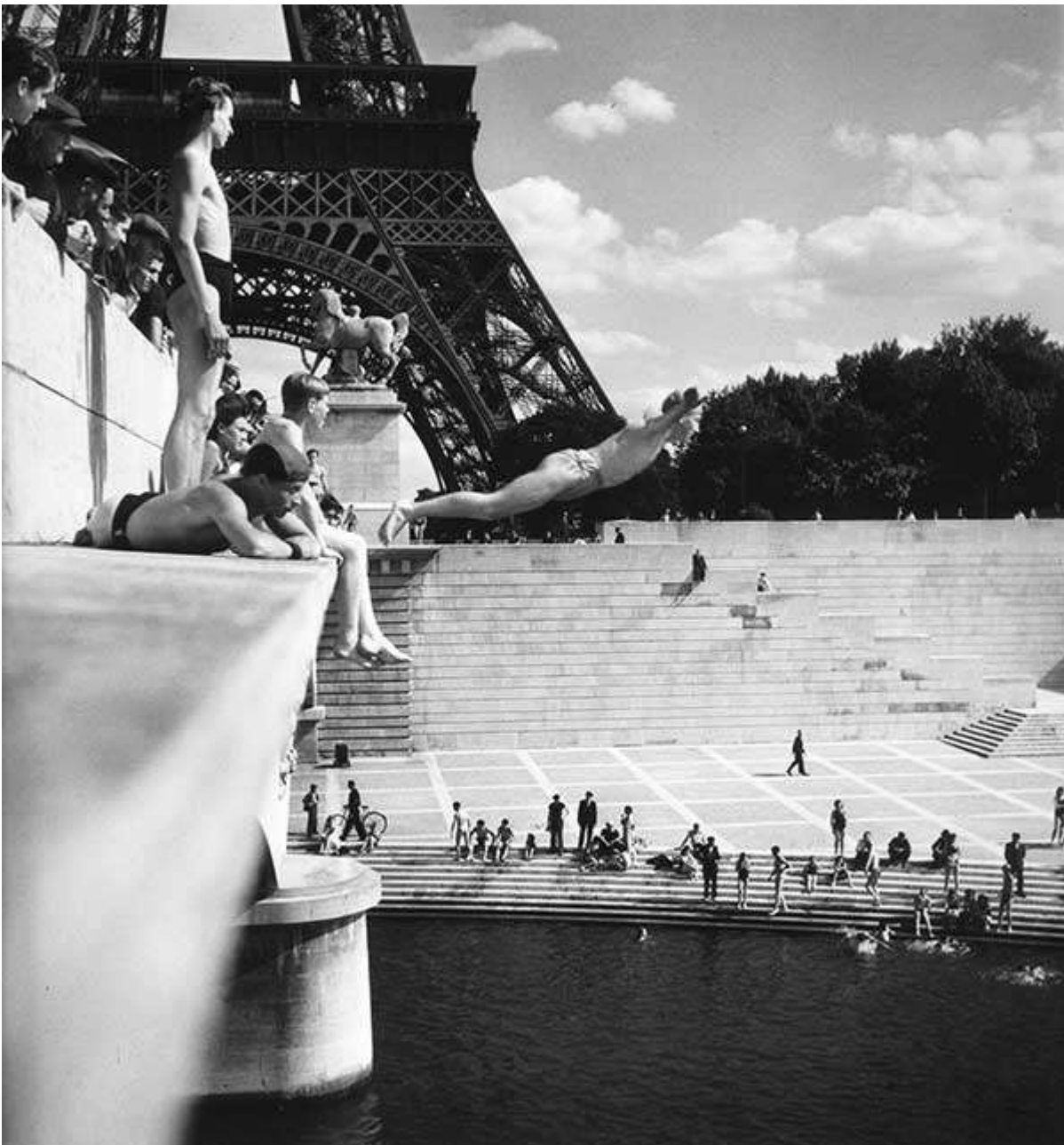
plongeur du Pont d'Iena, Paris 1945 HD Photographies

La mostra, dal titolo "Robert Doisneau. ICONES", presenta una serie di scatti del celebre fotografo, seguendo il fil rouge dell'iconicità, appunto, delle immagini, quelle che maggiormente hanno saputo conquistare l'immaginario collettivo e il grande pubblico, a partire dal celebre bacio del 1950