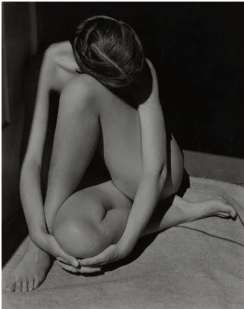
Edward Weston, Nude, 1936. Gelatin silver print on paper, 241 x 191 mm. The Sir Elton John Photography Collection, 1981 Center for Creative Photography, Arizona Board of Regents.

"Per me, ciascuna di queste fotografie è fonte d'ispirazione per la mia vita; sono esposte sulle pareti di casa, e le considero gemme preziose. Guardandole, voglio che le persone pensino: 'Non avevo mai visto qualcosa di simile prima, e non pensavo potesse esistere': ciò che ho pensato io, nel momento in cui ho incontrato ciascuna di esse".