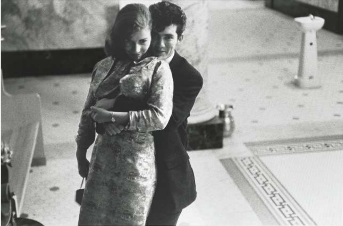
©Robert Frank, da Gli Americani , Municipio-Reno. Nevada, 1956

È il 1955 e un giovane fotografo europeo, Robert Frank, ottiene una borsa di studio dalla Fondazione Guggenheim per realizzare un lavoro fotografico sull'America. Frank percorrerà tutto l'immenso paese, e tra il 1955 e il 1956 "toccherà" ben 48 stati diversi. Le strade, i volti delle persone incontrate, le piazze delle città, i bar e i negozi, i marciapiedi, i particolari più insignificanti passano e si fermano di fronte all'obiettivo intelligente e partecipe del fotografo. Il risultato sarà Americani , un libro imperdibile che consacra il suo autore come un maestro della storia della fotografia.