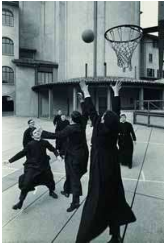
Basket in Seminario a Bergamo, 1964 stampa ai sali d'argento vintage print

La mostra raccoglie una serie di scatti in modo quasi seriale in diversi anni: frammenti di vita scattati durante i viaggi di lavoro.