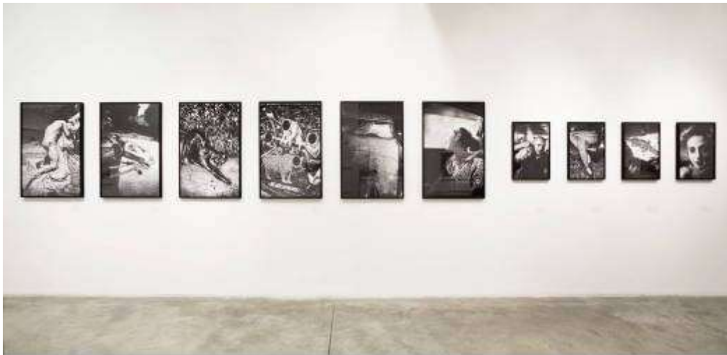
FOTOGRAFIA - Festival Internazionale di Roma, Andres Petersen, Rome

città essenziale di Koudelka, osserviamo l'opera di Anders Petersen, nella quale presenze umane tornano a popolare Roma, e anzi, ne sono protagoniste. La capitale diventa un luogo organico, più intimo. Allo stesso tempo la fotografia di Petersen, pur ritrovando l'umano, porta con sé una personalità cupa e trasforma Roma evidenziandone un aspetto complesso e precario.