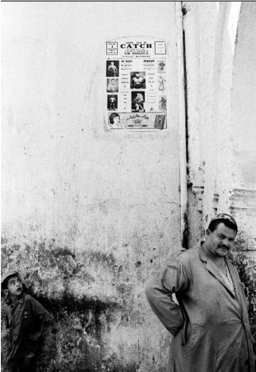
Gabriele Basilico, Marocco 1971.

In Iran avrebbe potuto essere forse Josef Koudelka, se all'epoca Gabriele avesse già potuto conoscerlo, ma in Iran c'è soprattutto la premonizione del Basilico maturo, il misuratore di spazi, quegli spazi abbacinanti, troppo asciutti e ingenerosi di pittoresco, eccedenti la misura dello sguardo europeo, che chiedevano da lui una visione non orientalista, non carica di passato, ma analitica e indagatrice.