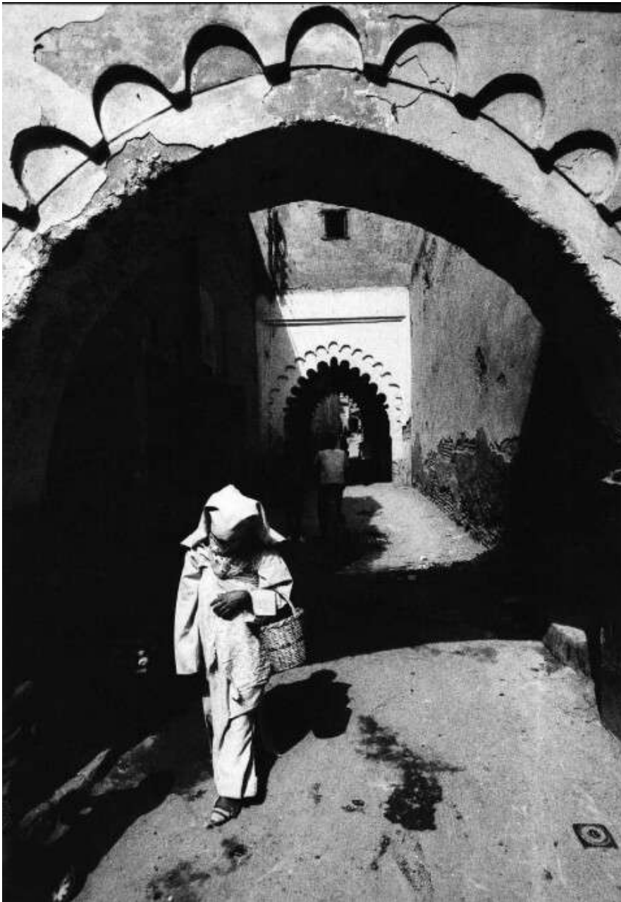
Gabriele Basilico, Marocco 1971.

Ma in questo caso no, scarterei l'ipotesi della sorpresa dopo avere guardato bene con quanta facilità e coerenza queste immagini si dispongono in sequenza sulle pagine. Una coerenza che va oltre lo schema apparentemente topografico-narrativo di quel foglietto.