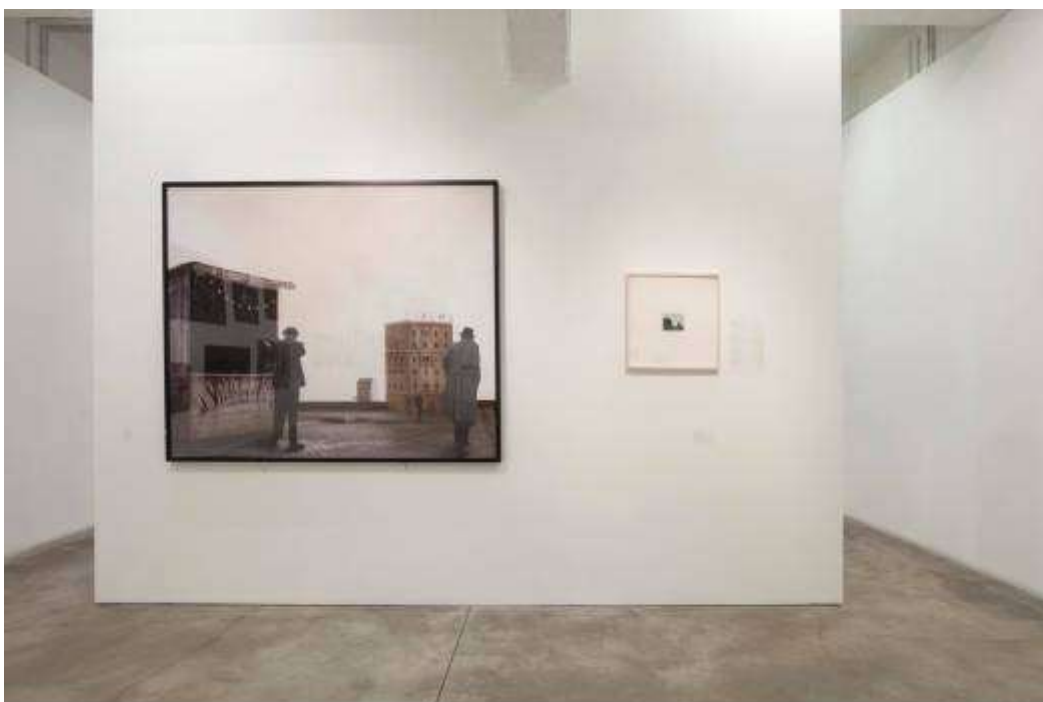
FOTOGRAFIA - Festival Internazionale di Roma, Paolo Ventura - Lo zuavo scomparso

L'indagine di Gabriele Basilico si sviluppa lungo le sponde del fiume Tevere, un racconto che segue la corrente e che ritrae una Roma silenziosa, paradossalmente immobile, come fosse un affascinante dipinto dai colori sbiaditi e dalle nuances metalliche. Ritroviamo toni lividi anche nell'opera di Paolo Ventura, in bilico tra finzione e realtà, una "pittura d'ombre che erodono la luce" come recita la poesia "Un demone fotografico" di Paul Valery. Ventura immagina uno zuavo perso per la città, un soldato che vaga per ambienti spogli creando un effetto aberrante.